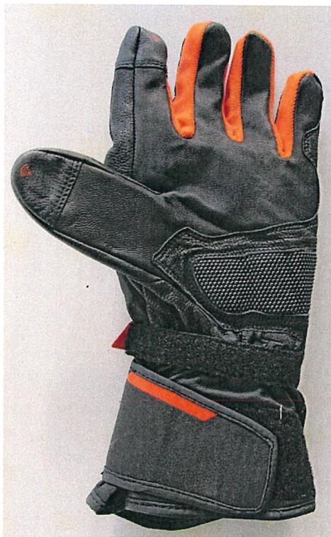
Außenseite / outside